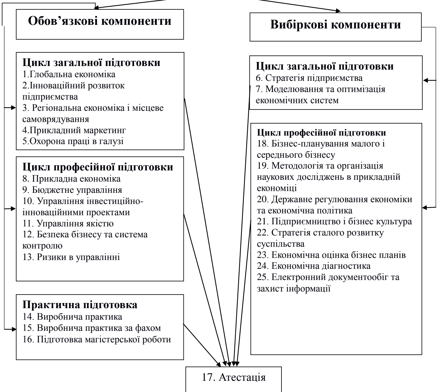
Рис. 1. Схема компонентів освітньо-професійної програми «Прикладна економіка»