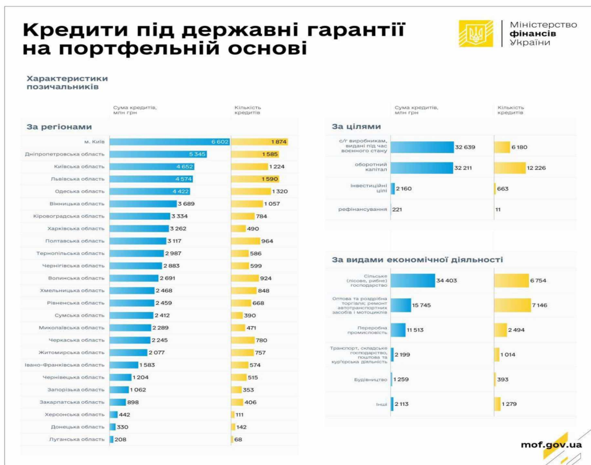
Рис 2.4. Обсяг кредитів під державні гарантії на портфельній основі за регіонами.

Львівська область: 1 590 справ на суму 4,6 млрд грн . Рис. 2.4.