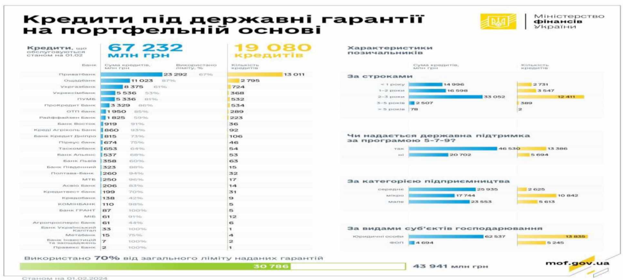
Рис 2.3. Обсяг кредитів під державні гарантії на портфельній основі.

Станом на 1 лютого 2024 року 29 банків-кредиторів видали 19 080 кредитів на суму 67,2 млрд грн. Основні зобов'язання, частково забезпечені портфельними державними гарантіями, склали 30,8 мільярда гривень. Це приблизно 70% від загального гарантійного ліміту (43,9 млрд грн). Рис. 2.3.